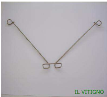
Molla per pali in metallo senza gancio di chiusura