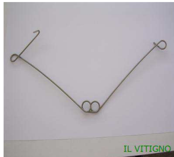
Molla per pali in legno con gancio di chiusura