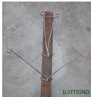
Molla per pali a T versione aperta e chiusa con gancio di chiusura